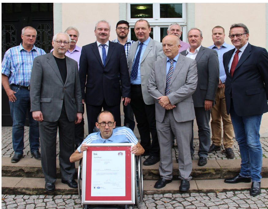
Gruppenbild mit Urkunde: Zum vierten Mal gelang den Werkstätten mit Bravour die Re-Zertifizierung: Das neue Zertifikat nach ISO 9001:2015 von BSI hat eine Gültigkeit von drei Jahren bis 28. Juli 2020.

Das Transition-Audit von der bisherigen Norm ISO 9001:2008 nach ISO 9001:2015 fand im Juni des Berichtsjahres gleichzeitig an allen Standorten der Caritas Werkstätten durch BSI Auditor Dipl. Kaufmann Michael E. Triesch statt.